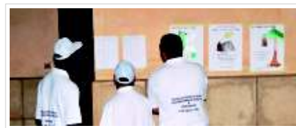
A diferencia de informaciones difundidas por sectores interesados, la campaña política en Guinea Ecuatorial se desarrolla con toda normalidad, y todos los partidos tienen libertad para hacer sus respectivas campañas. Igualmente falsa es la "noticia" de que no se exponen los censos públicos.